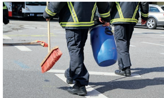
Mit ÖlBond ist schnell und sicher der Boden wieder sauber.